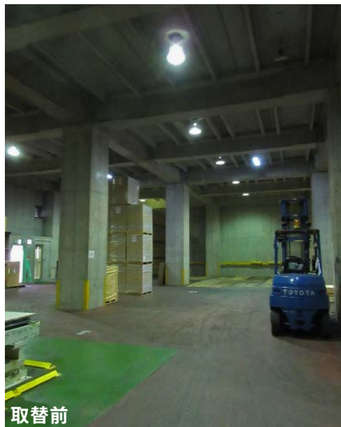
取替前は全体にやや暗く、伝票等の書類や商品のラベルが見つらいこともありました。