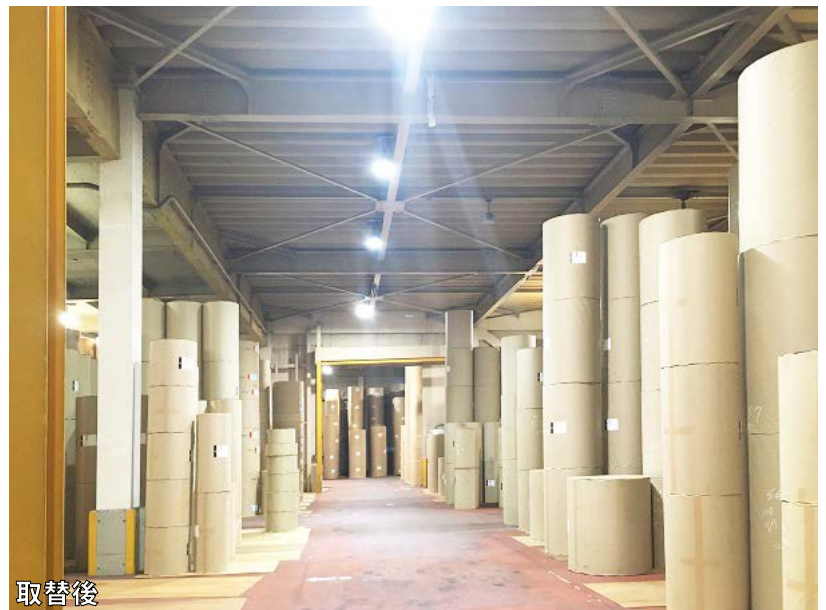
LEDへの取り替えにより照度が3~5倍アップ。照明が点灯していると、人やフォークリフトが近くにいる目印にもなるため、注意喚起の観点からもセンサーライトは役立っています。