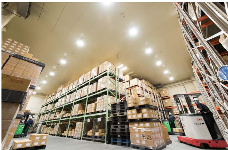
常温15℃に設定された物流センター。センサー制御で使用電力を大幅に削減できただけでなく、平均照度も約50%アップし、安全面の確保、作業効率の向上も実現しました。