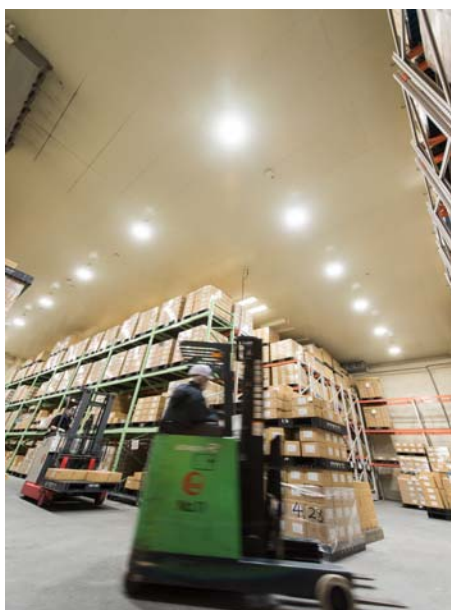
照明に内蔵されたセンサーがフォークリフトを検知し、必要な時だけ照明が点灯します。