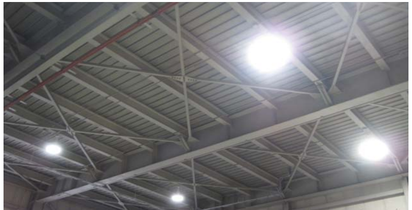
蛍光灯から高天井用LEDセンサーライトに取り替えられたサイチ工業(株)栗東工場内。作業員の方から取替前の蛍光灯よりはるかに明るく、またLEDにしては眩しくないという好評です。