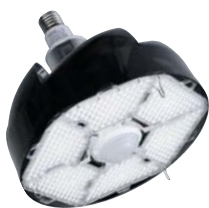
MB-400-E39 器具光束 13,500 lm 消費電力 130W