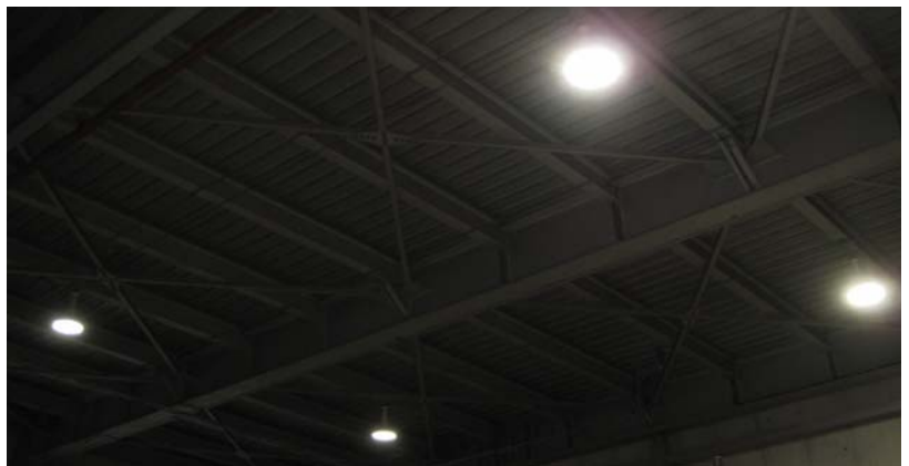
20%の明るさ(ほんのり点灯)にした状態。以前は24時間つけっぱなしでしたが、人の出入りや作業に必要な時だけ点灯する照明になり、社員の省エネ意識が高まったとのこと。