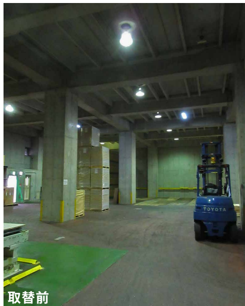
取替前は全体にやや暗く、伝票等の書類や商品のラベルが見つらいこともありました。